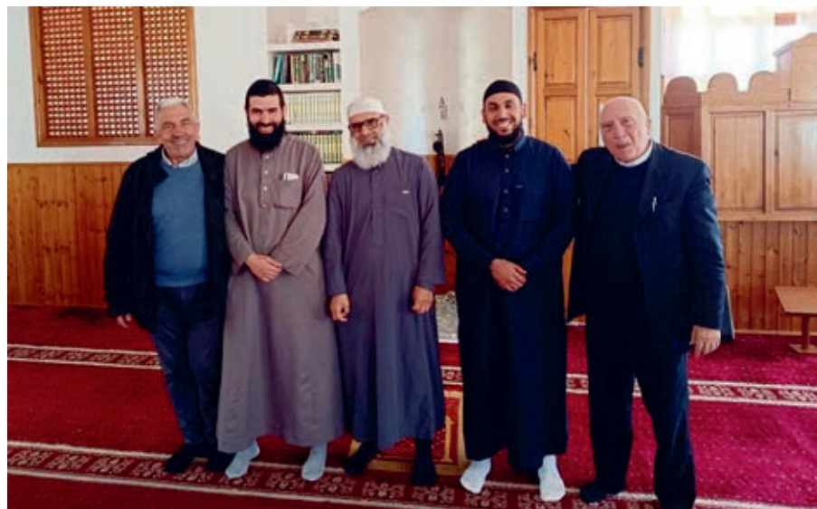
Un recente incontro tra i direttori diocesani di Caritas e Migrantes e i responsabili delle comunità islamiche

L'ecumensimo è, prima di tutto, un movimento interno al cristianesimo. Il suo obiettivo è ambizioso: riavvicinare e, idealmente, riunire tutte le Chiese cristiane - cattolica, ortodossa, protestante e le altre confessioni - superando le divisioni storiche che nel corso dei secoli hanno lacerato il corpo della Chiesa. Il fondamento è comune: il battesimo e la fede nella Trinità. Lo strumento è il dialogo, la preghiera condivisa, la collaborazione. «Il movimento dell'unità dei cristiani non è una appendice che si aggiunge all'attività tradizionale della Chiesa», ammoniva papa Giovanni Paolo II. «Al contrario, esso appartiene organicamente alla sua vita e alla sua azione.» Un'affermazione che trovò terreno fertile nel Concilio Vaticano II, il quale con il decreto Unitatis Redintegratio tracciò la rotta dell'impegno ecumenico cattolico. Ma attenzione: ecumensimo non significa uniformismo. Non si tratta di cancellare le differenze dottrinali tra le confessioni, bensì