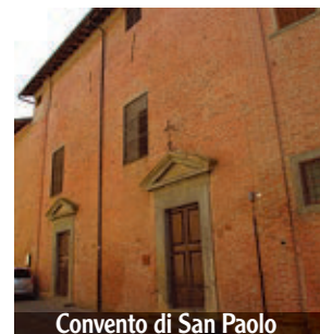
Convento di San Paolo