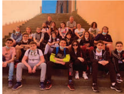
Ragazzi delle medie di Fucecchio sulla scalinata che porta in Piazza Duomo col vescovo Andrea