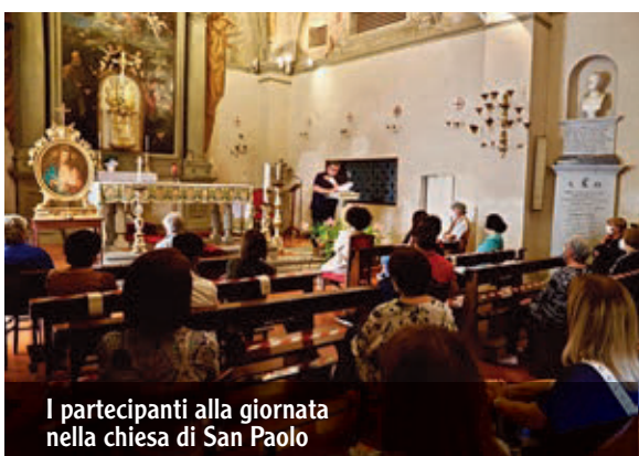
I partecipanti alla giornata nella chiesa di San Paolo