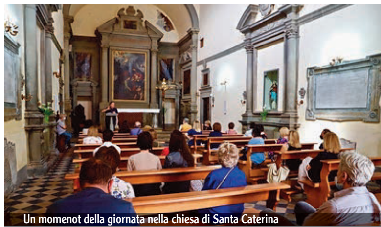
Un momentot della giornata nella chiesa di Santa Caterina