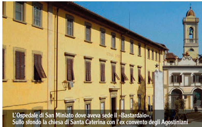
L'Ospedale di San Miniato dove aveva sede il «Bastardaio». Sullo sfondo la chiesa di Santa Caterina con l'ex convento degli Agostiniani